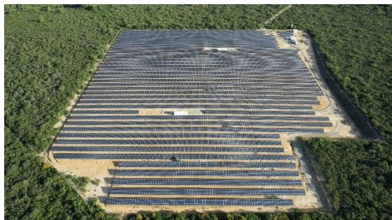
Imagem 2 – complexo Solar Caetité

O Complexo Solar Caetité, localizado no sudoeste da Bahia, tem capacidade instalada de 4,8MWp, composto por 19.200 módulos/placas de 245W cada e 4 inversores.