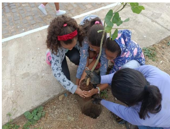
Imagem 1- Realização de oficina de educação ambiental e plantio de mudas nativas nas Áreas de Influência do Alto Sertão III.

Também foram realizadas palestras sobre os principais tipos de fontes de energias renováveis e seus benefícios para o meio ambiente, promovendo a conscientização sobre a importância dessas fontes como alternativa sustentável para o desenvolvimento socioambiental.