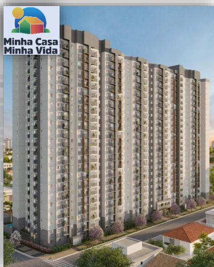
*Perspectiva em 3D da Fachada.