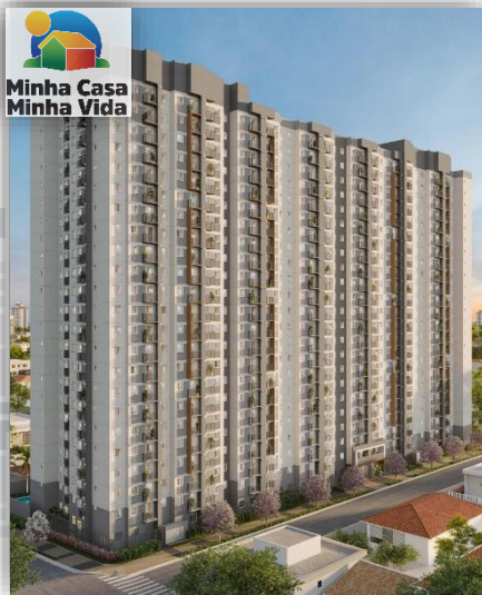
* 3D perspective of the facade.