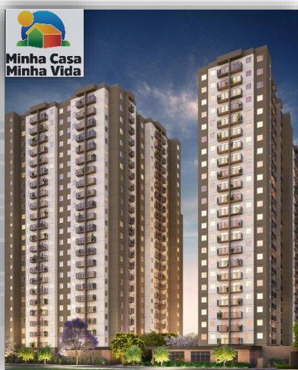
*Perspectiva em 3D da Fachada.

Para obter mais detalhes, acesse o link .