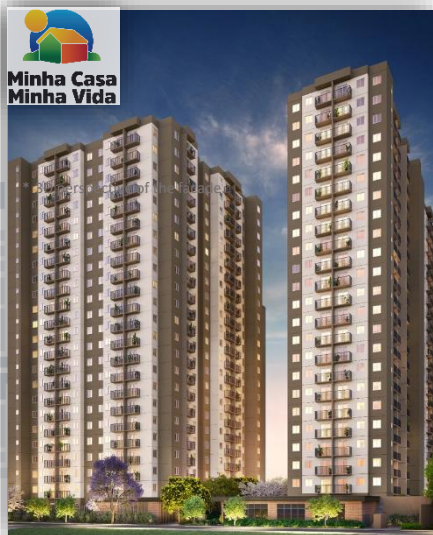
* 3D perspective of the facade.