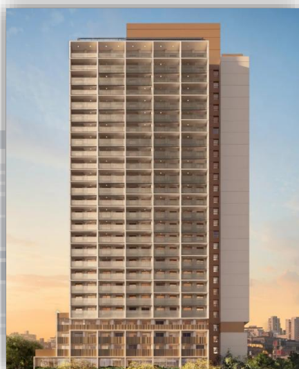
* 3D perspective of the facade.