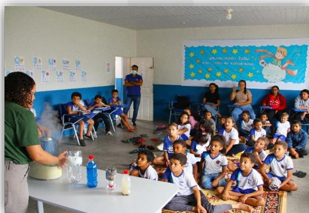
Fotos 1 e 2: Palestras de “Conservação da Água” em escola da Área de Influência dos Empreendimentos em Operação.

Em governança, a Renova Energia deu continuidade à consolidação, organização e estruturação dos próximos passos para o atendimento às normas IFRS, reforçando a preparação para as exigências regulatórias futuras. As iniciativas desenvolvidas no período refletem o compromisso da Companhia com a transparência, o aprimoramento da gestão de riscos e a integração da sustentabilidade à estratégia corporativa, visando a geração de valor sustentável no longo prazo.