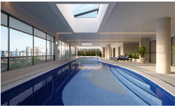
Illustrated perspective of the indoor Swimming pool

With units ranging from 114 to 136 sqm (2 and 3-bedroom suites), Casa Nacional is aimed at the middle-high income segment, in a location that for many will become the new heart of São Paulo. A private haven that celebrates a lifestyle that is light, sophisticated, and deeply Brazilian.