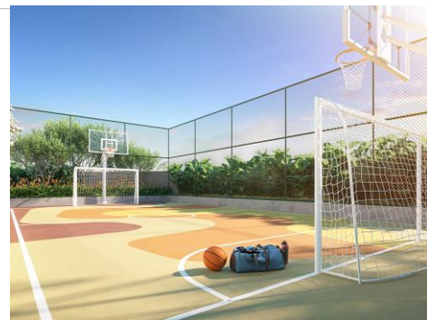
Illustrated perspective of the Sports Court

With 47 years of operations , EZTEC is one of the most profitable publicly-traded companies in Brazil's real estate development and building industry. Based on its fully integrated business model, EZTEC has already launched 197 projects , totaling more than 5.8 million square meters of built area and area under construction, and 48,006 units .