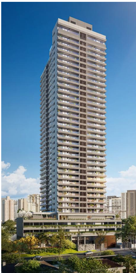
Illustrated perspective of the facade