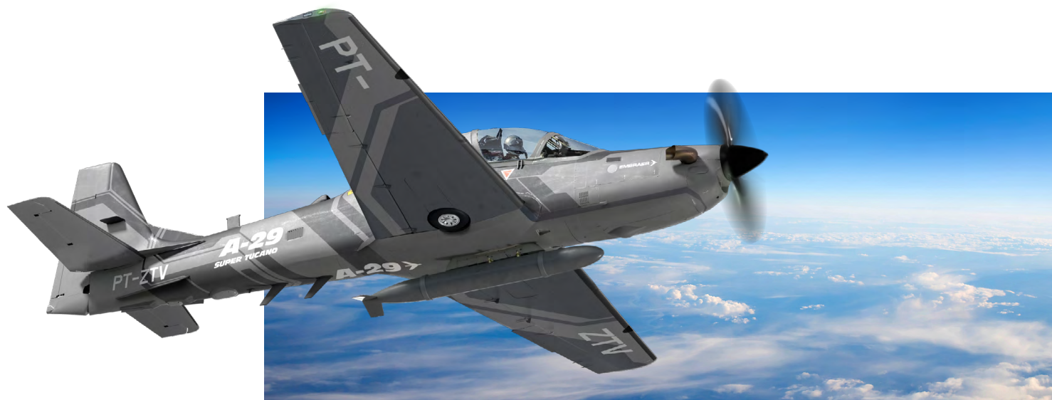
A-29 Super Tucano

*Inclui apenas os A-29 Super Tucano encomendados a partir de 2024. Um total de 264 aeronaves foram entregues até 2023.