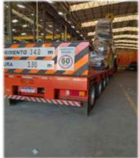
Portaria - Entrada / Saída de Caminhões